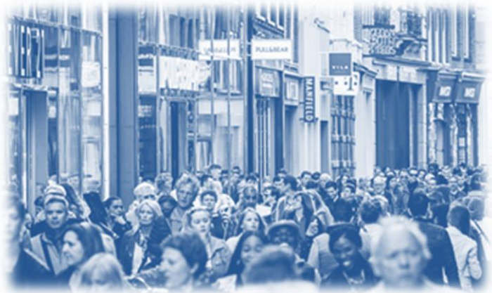
Foto: de Kalverstraat

De populariteit van Amsterdam bij toeristen en dagjesmensen heeft grote gevolgen voor de stad, zo blijkt uit een onderzoek van analytici van de Amsterdamse Politie. Op plekken als de Wallen, de Negen Straatjes en de Kalverstraat dreigt 'overcrowding', zo constateert het onderzoek. Deze term wordt normaliter gebruikt bij grote evenementen.