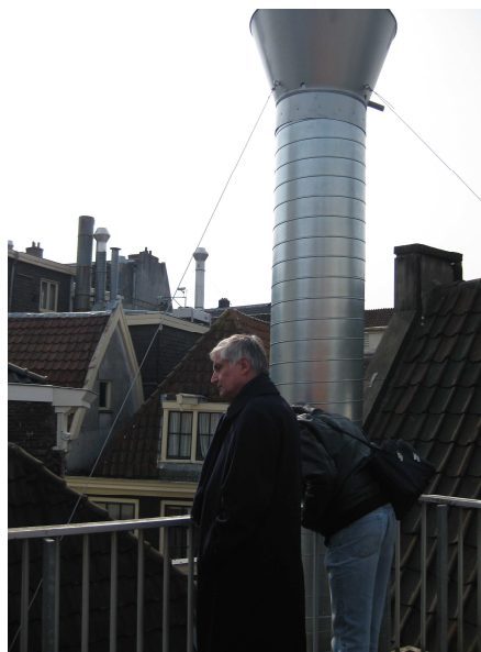
Afbeelding boven: bovenaanzicht binnenplaats en afvoerpijp 2 Afbeelding rechts: pijp geplaatst in april 2013, op locatie tekening 2